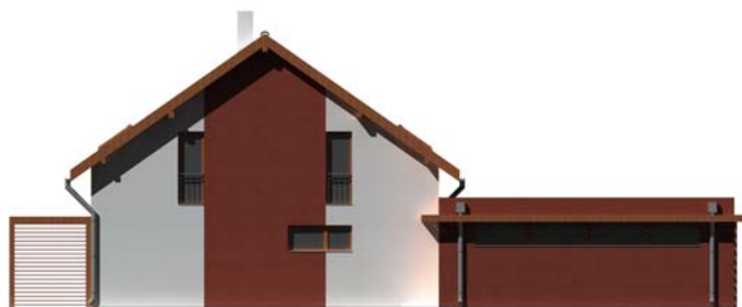
POHLED BOČNÍ (GARÁŽ)